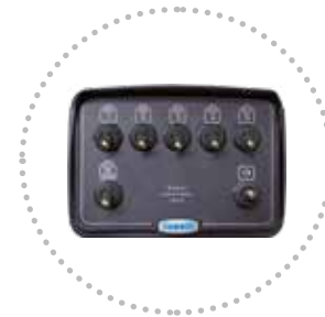
Comando elettrico Electric panel