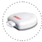
Sensore Velocita Gps GPS speed sensor