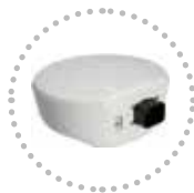
Ricevitore Gps Gps Receiver