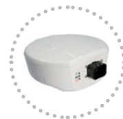
Ricevitore Gps Gps Receiver