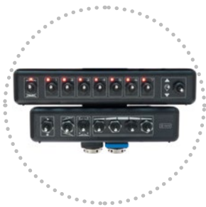
Comando elettrico Electric panel