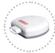
Sensore Velocita Gps GPS speed sensor