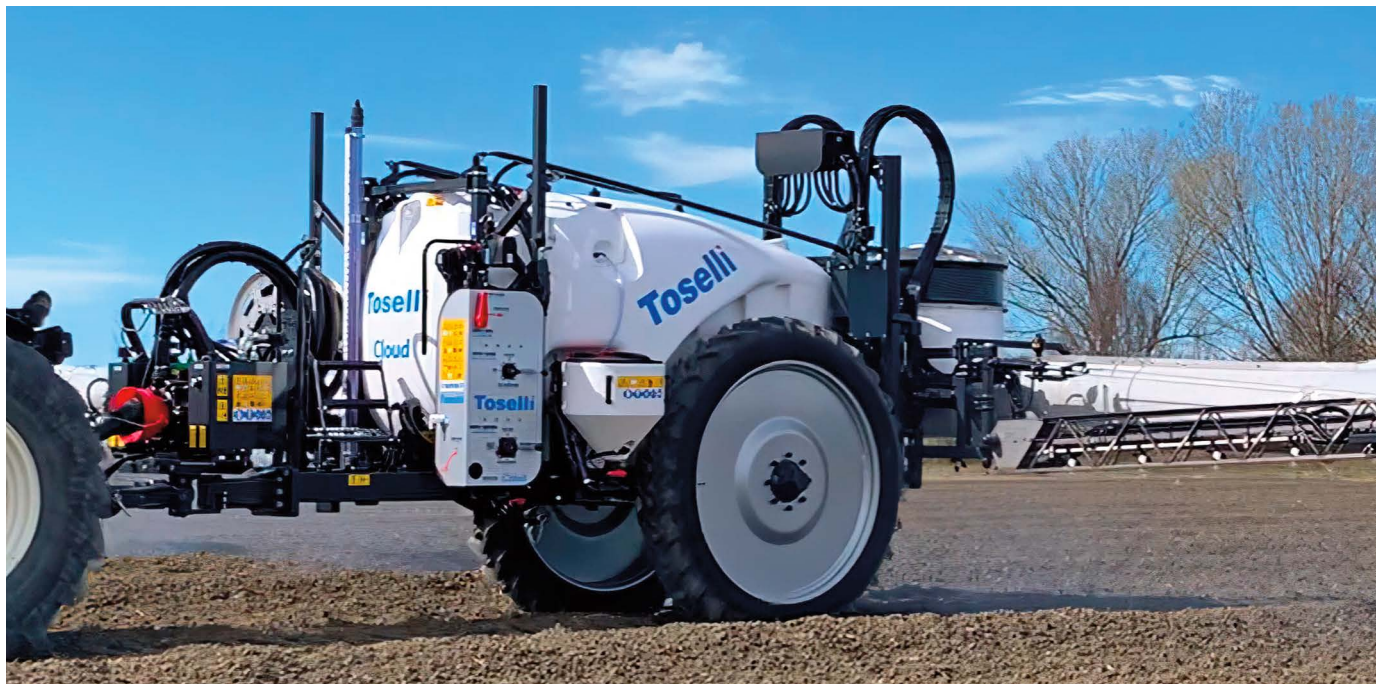
Cloud 3000 con carreggiata stretta (mm. 1500) assicura massima stabilità e sicurezza anche nelle condizioni più avverse Cloud 3000 with narrow wheeltrack (mm. 1500) provides maximum safety and stability even in most adverse conditions