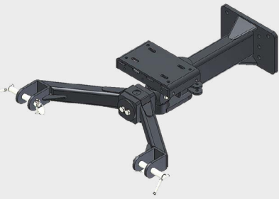
Timone sterzante al sollevatore. Steering drawbar at the lifter.