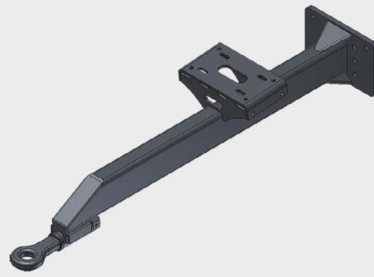
Timone fisso con occhio per gancio di traino (opzionale). Steady drawbar with towing eye (optional).